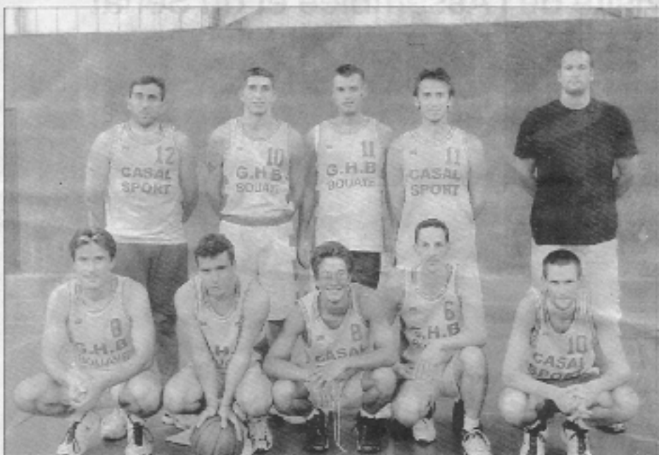
Les seniors M1 du Basket club d'Herbauges.

Côté sportif, les structures sont aussi bien en place et les résultats semblent confirmer un renouveau, notamment avec les seniors 2, garçons et filles, qui déjà songent à la montée. Au niveau des entraîneurs,