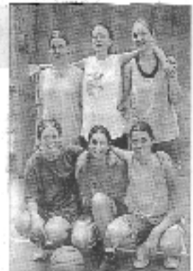
Les cadettes de la Saint Médard ont été motivées.