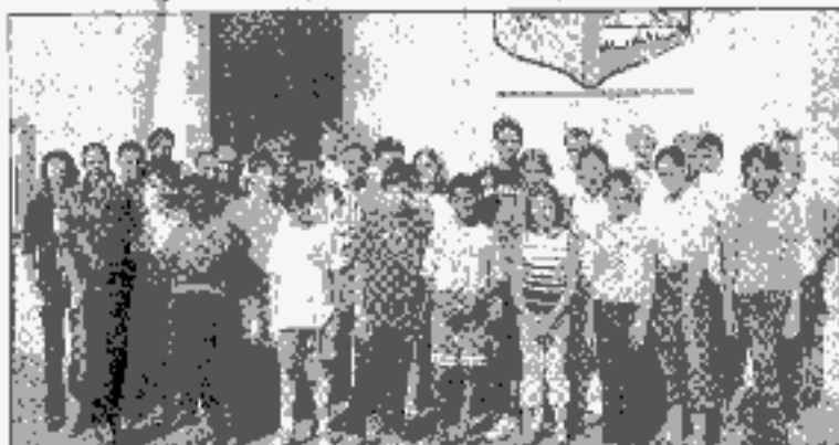
Les jeunes prêts à jouer le relais.