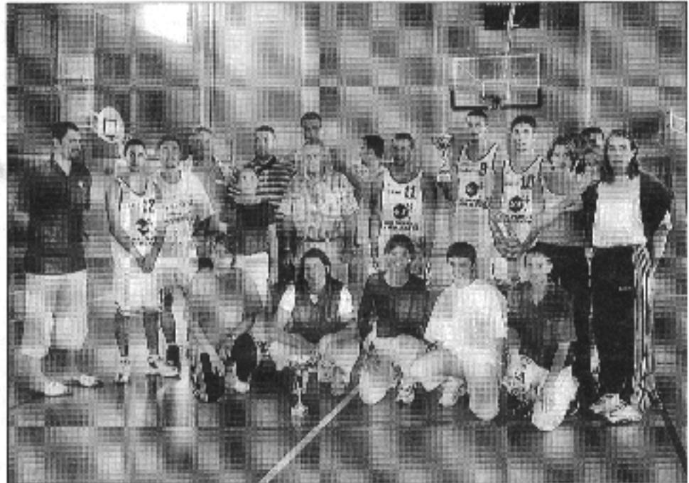
La remise des coupes aux équipes de Vierzon (masculine) et Crossac (féminine).